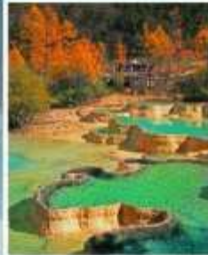
อุทยานแห่งชาติ หวงหลง