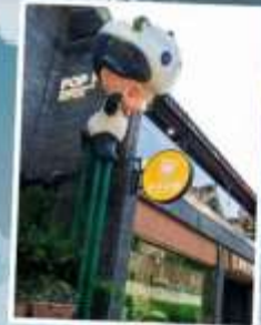
ถนนคนเดิน ชอยกวางแคบ