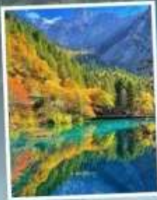
อุทยานแห่งชาติ จิวจ้ายโกว

รับฟรี!! ประกันสุขภาพ และ อุบัติเหตุ 2 ล้านบาท