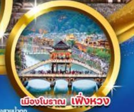
เมืองโบราณ เฟิ่งหวง

เดินทาง : 17-21 ก.ค.68 24-28 ก.ค.68 07-11 ส.ค.68, 28 ส.ค.- 01 ก.ย.68 ,18-22 ก.ย.68