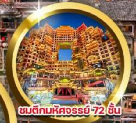
ชมตึกมหัศจรรย์ 72 ชั้น