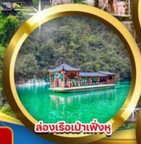
ล่องเรือป่าเฟิ่งหู