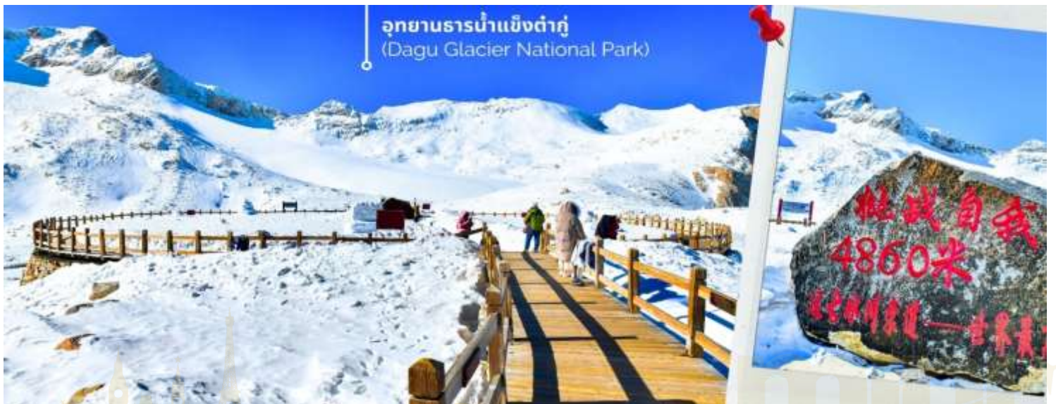
อุทยานธารน้ำแข็งต้ากู่ (Dagu Glacier National Park)