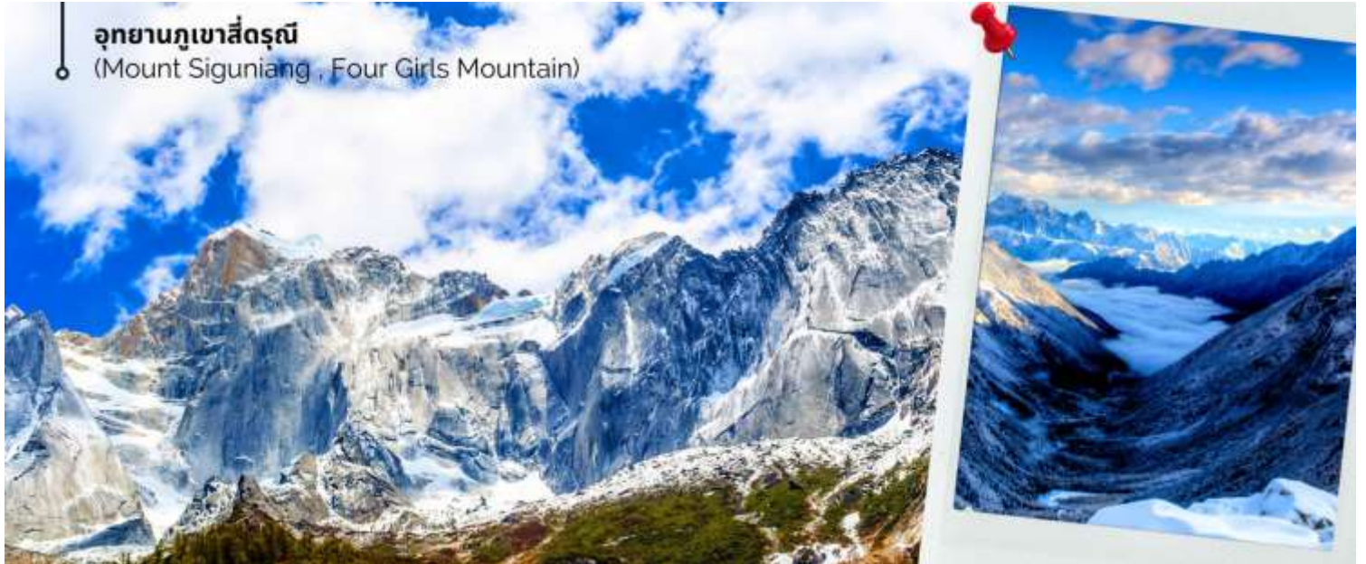
อุทยานภูเขาสี่ดรุณี (Mount Siguniang , Four Girls Mountain)

ระยะเวลาการเปลี่ยนสีของใบไม้ และการตกของหิมะขึ้นอยู่กับสายพันธุ์และสภาพอากาศ