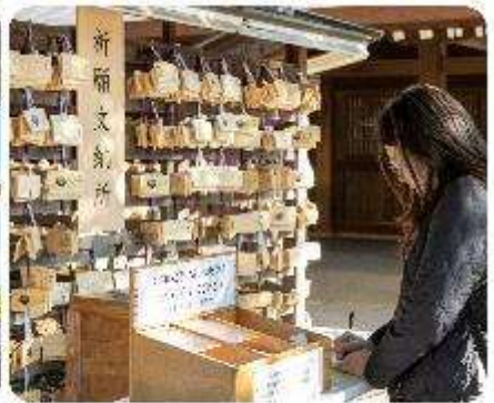
ศาลเจ้าเมจิจิงกู

ศาลเจ้าเมจิ หนึ่งในสถานที่อันศักดิ์สิทธิ์ใจกลางกรุงโตเกียว สิ่งแรกที่จะทำให้คุณประทับใจคือการเดินผ่านเสาโทริอิขนาดใหญ่ ระหว่างทางมีธรรมชาติที่ทำให้รู้สึกเหมือนก้าวเข้าสู่อีกโลกหนึ่ง ที่เต็มไปด้วยความสงบ อีกทั้งยังสามารถเขียนคำอธิษฐานลงบนแผ่นไม้ "เอมะ" เพื่อขอพรสำหรับความสุขและความสำเร็จในชีวิตอีกด้วย จากนั้นนำพาทุกท่าน...ซ็อบปังกันต่อใจกลางกรุงโตเกียว เมืองที่เป็นศูนย์กลางของแฟชั่นและนวัตกรรม และเปิดประสบการณ์การซ็อบปังที่ไม่เหมือนใคร! สักรวดย่านต่าง ๆ ที่แต่ละแห่งที่มีเสน่ห์และเอกลักษณ์อันโดดเด่น เมืองที่เต็มไปด้วยชีวิตชีวาและความทันสมัยที่หลากหลายอย่าง ย่านฮาราจุกุ แหล่งรวมแฟชั่นที่แปลกใหม่และสดใส เดินเล่นบน Takeshita Street ที่เต็มไปด้วยเสื้อผ้าและเครื่องประดับที่ไม่ซ้ำใคร เพลิดเพลินกับบรรยากาศสุดคูลที่เป็นเอกลักษณ์