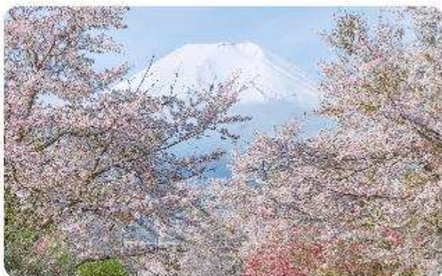
หมู่บ้านน้ำใสโอชิโนะ อักโก

โอชิโนะ อักโก หรือ ที่รู้จักกันในชื่อ หมู่บ้านน้ำใส ความงามแห่งธรรมชาติและวัฒนธรรมที่ ซ่อนอยู่ใต้ภูเขาไฟฟูจิโอชิโนะ อักโก ตั้งอยู่ในหมู่บ้านโอชิโนะ จังหวัดยามานาชิ ประเทศญี่ปุ่น เป็นแหล่งน้ำธรรมชาติที่มีชื่อเสียง ประกอบด้วยบ่อน้ำใสสะอาดทั้งแปดแห่ง ซึ่งน้ำในบ่อเหล่านี้เกิด จากการละลายของหิมะและน้ำแข็งจากภูเขาไฟฟูจิ น้ำที่ไหลลงมานั้นได้ถูกกรองผ่านชั้นหินภูเขาไฟ เป็นเวลาหลายปี จนทำให้น้ำในบ่อมีความบริสุทธิ์และใสจนเห็นถึงก้นบ่อ ไม่เพียงแต่ความงามของ