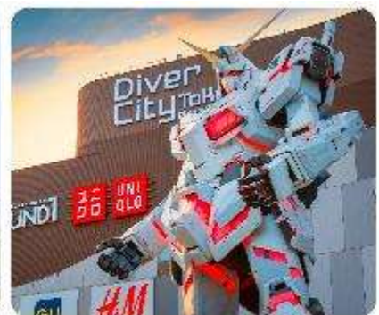
ย่านโอไดบะ ห้างไดเวอร์ซิตี ODAIBA SEASIDE PARK