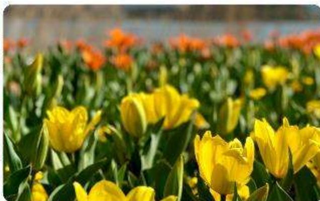
สวนโออิชิ ปาร์ค

สวนดอกไม้โออิชิ พาร์ค (Oishi Park) มหัศจรรย์แห่งวิวกุเขาไฟฟูจิ หนึ่งในจุดชมวิวของ ภูเขาไฟฟูจิที่สวยงามที่สุดอีกจุดหนึ่ง ที่จะเติมเต็มความสงบและความงดงามของธรรมชาติในญี่ปุ่นเมื่อ ไปเยือน คือสถานที่ที่ไม่ควรพลาด สวนดอกไม้โออิชิ พาร์ค (Oishi Park) แห่งนี้ไม่ได้เป็นเพียง สถานที่ที่มีดอกไม้สวยงามให้เราได้ชื่นชมแล้ว จุดเด่นของสวนนี้คือวิวกุเขาฟูจิที่อยู่เบื้องหลังสวน ดอกไม้สีแสนสดใส ที่บานสะพรั่งในทุกฤดูกาล และยังเป็นมุมที่เราได้สัมผัสกับวิวกุเขาฟูจิได้อย่าง ใกล้ชิด จากนั้นนำพาทุกท่านสู่..