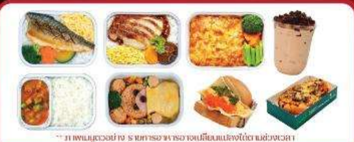
** ภาพเมนูตัวอย่าง รายการอาหารอาจเปลี่ยนแปลงได้ตามช่วงเวลา