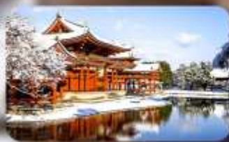
วัดเบียวโดจิน