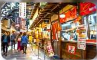
ตลาดปลาคูโรชิโอะ

NAGOYA/GIFU HOTEL AREA หรือเทียบเท่ามาตรฐานญี่ปุ่น GERO / GUJO HOTEL AREA หรือเทียบเท่ามาตรฐานญี่ปุ่น OSAKA HOTEL AREA หรือเทียบเท่ามาตรฐานญี่ปุ่น OSAKA HOTEL AREA หรือเทียบเท่ามาตรฐานญี่ปุ่น