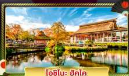
ไอชิโนะ ฮัตโค

ขึ้นกระเช้าลอยฟ้าฮาโกเนะ ชมวิวทะเลสาบอะชิโนะโทะ