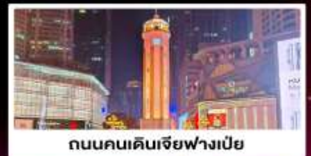
ถนนคนเดินเจียฟางเป็ย