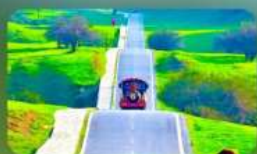
เขานางฟ้า