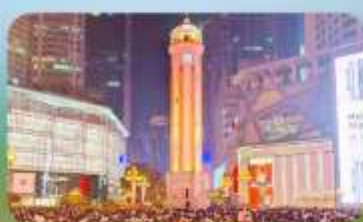
ถนนคนเดินเจียฟางเป่ย์