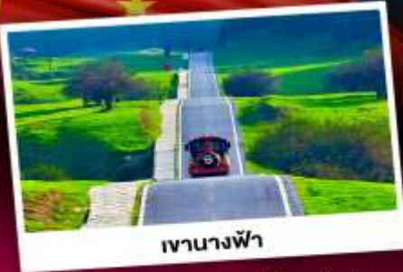
เขานางฟ้า

อุทยานหลุมฟ้าสามสะพานสวรรค์ มรดกโลกเขานางฟ้า ซุปบึงถนแดนแดน