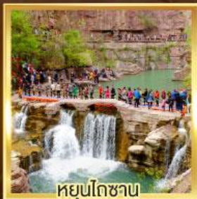
หยุนโกซ่าน