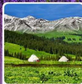
ทุ่งหญ้านาลาตี