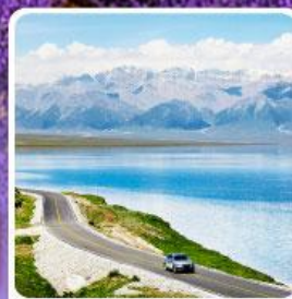
ทะเลสาบไซหลี่มู่