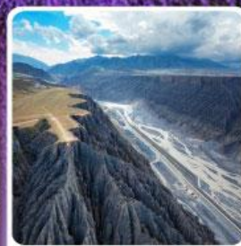
แกรนด์แคนยอนคู่ซานจื่อ