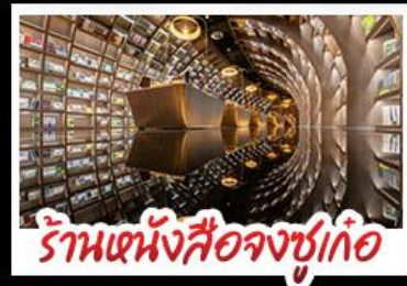
ร้านหนังสือจงซูเก๋

ภูเขาสี่ดรุณี - อุทยานπίงโกว - รูปปั้นหมีแพนด้า นอนเซลฟี ร้านหนังสือจงซูเก๋ - วัดต้าฉือ - ถนนโบราณชอยกว้างชอยแคบ แม่บูพิศษ สุกี้หมาล่าเสฉวน