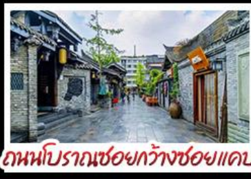
ถนนโบราณชอยกว้างชอยแคบ