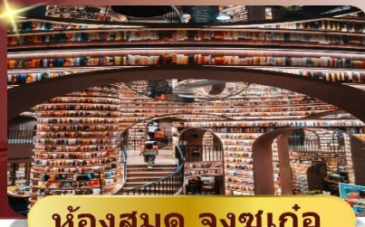
ห้องสมุด จงซูเก้อ