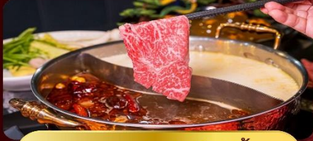
ชาบูหม่าล่าไม่อัน