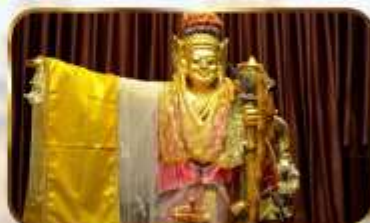
เทพทันใจโจ้เข้า