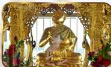
ขอพระพระอุปคุต ปางจกบาตรเยียมาร