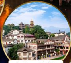
เมืองโบราณฉือจี้โข่ว