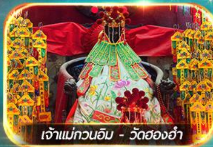
เจ้าแม่กวนอิม - วัดสองอ้า