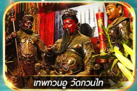
เทพกวนอู วัดกวนไท

พามุไหว้พระขอพร 8 วัดดัง, อิสระช้อปปิ้ง 1 วันเต็มแบบจุใจ