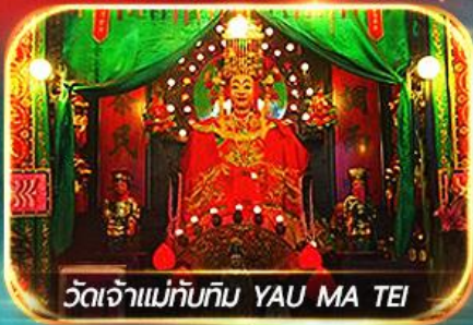
วัดเจ้าแม่ทับทิม YAU MA TEI