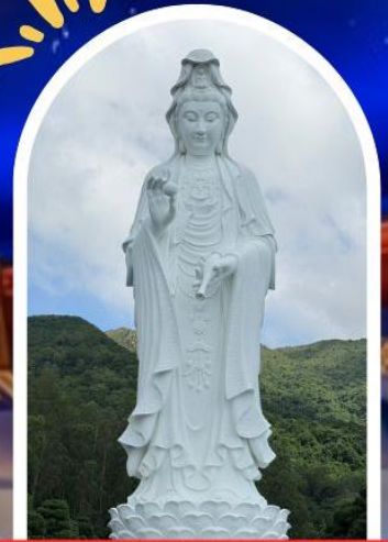
วัดชีซัน