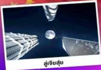
ดูเจ็ทสูย