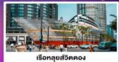
เรือทลุยส์วิตคอง