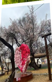
สวนแอปเปิ้ลคอก