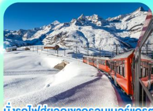
นั่งรถไฟสู่อยอดเขากรอนเนอร์เกรต