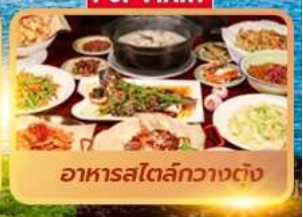
อาหารสตรีทกวางตุ้ง