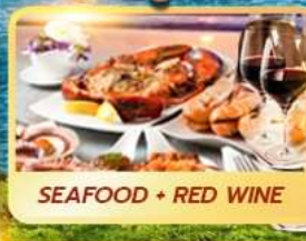
SEAFOOD + RED WINE