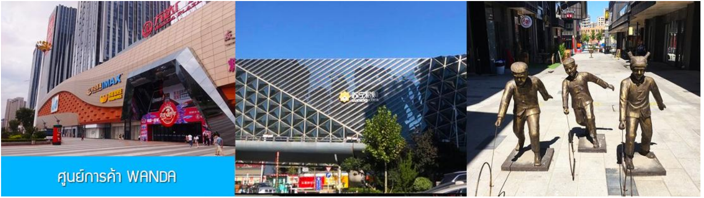
ศูนย์การค้า WANDA

จากนั้นนำท่านสู่ ศูนย์การค้า WANDA 大连万达广场 ให้ท่านอิสระเดินช้อปปิ้ง หรือเลือกชิมอาหารพื้นเมืองภายในห้างสรรพสินค้าที่ทันสมัยแห่งนี้ได้ตามอัธยาศัย