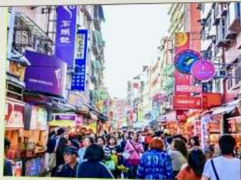
ถนนโบราณตี๋นส่วย