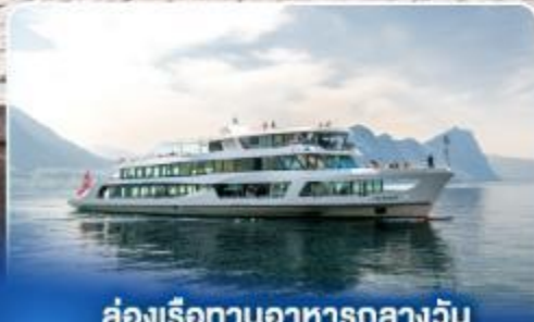
ล่องเรือทานอาหารกลางวัน ทะเลสาบลูเซิร์น