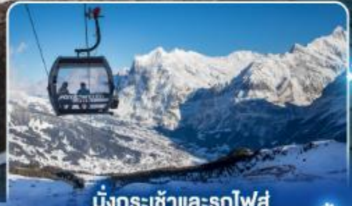
นั่งกระเช้าและรถไฟสู่ ยอดเขาจุงเฟรา