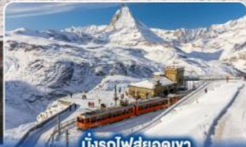
นั่งรถไฟสู่ยอดเขา กรอนเนอร์เกรต