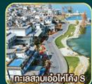
ทะเลสาบเอ๋อไห่คัง S