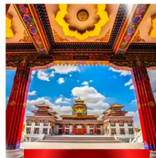
วัดโพธิ์สัตว์