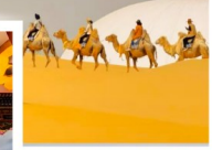
ปาร์ตี้รอบกองไฟ