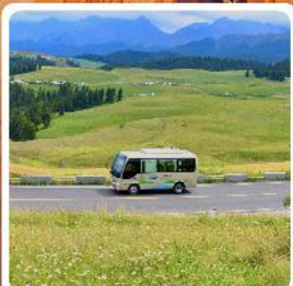
ทุ่งหญ้าเจียนปูลาเค่อ