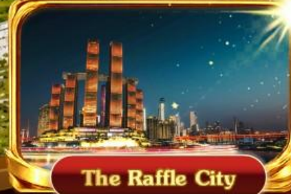
The Raffle City