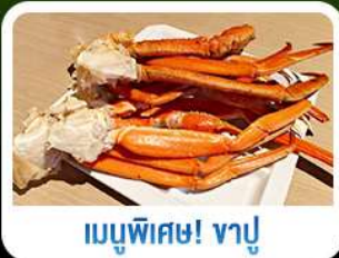
เมนูพิเศษ! ซาซิมิ