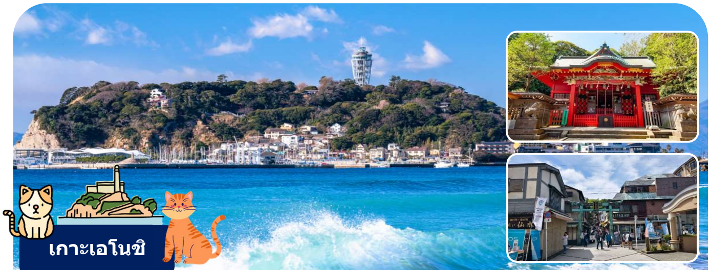
เกาะเอโนชิ

นำท่านเดินทางสู่เมืองคามาคุระ จังหวัดคางาวะ เมืองประวัติศาสตร์ที่ขึ้นชื่อเรื่องวัดวาอาราม และวิวทะเลสุดโรแมนติก ให้ท่านได้สัมผัสกลิ่นอายญี่ปุ่นแบบดั้งเดิมผสมผสานกับความสงบของธรรมชาติ