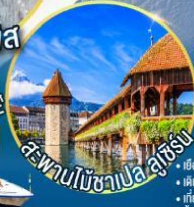
สะพานไม้ชาเปล ลูเซิร์น