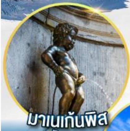
มานกันพิส