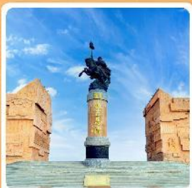
เขตท่องเที่ยวเจงกิสข่าน