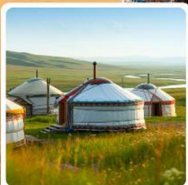
ที่พักแบบกระโจม