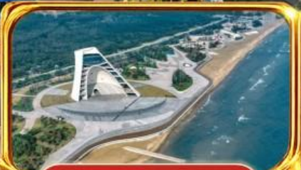
หอดอยกาลเวลา