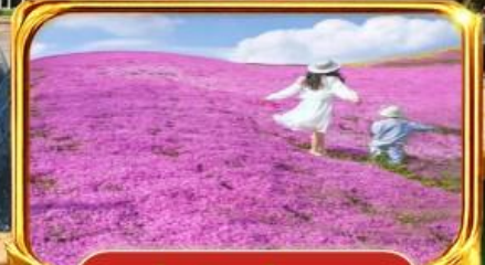
ทุ่งฟิงคิมอส