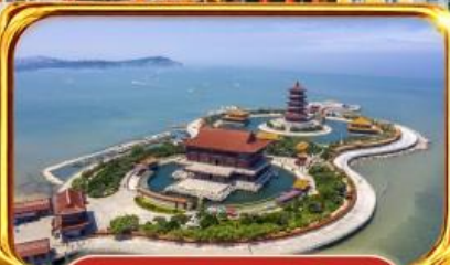
จุดชมวิว 8 เขียน