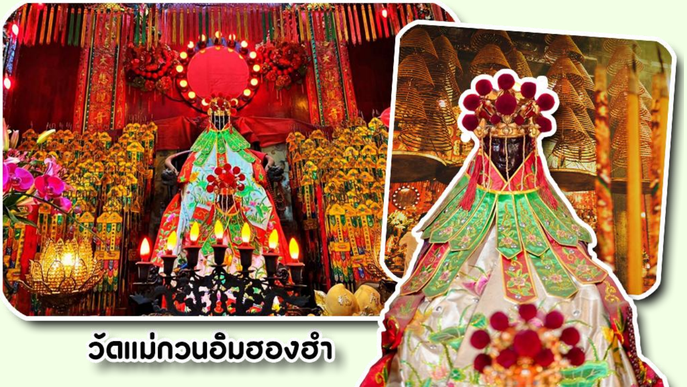
วัดแม่กวนอิมสองอ้า

จากนั้นพาท่านเข้าไปไหว้ขอพร วัดแม่กวนอิมสองอ้า วัดเก่าแก่ของฮ่องกงสร้างตั้งแต่ปี ค.ศ .1873 เป็นวัดขนาดเล็กที่มีชาวฮ่องกงศรัทธา นับถือกันเป็นอย่างมากวัดแห่งนี้เป็นที่ประดิษฐาน องค์เจ้าแม่กวนอิมสองอ้า ที่มีชื่อเสียงเรื่องการให้กู้ยืมเงินเชื่อกันว่าท่านช่วยพลิกฟื้นเศรษฐกิจของชาวฮ่องกง ผู้คนจึงนิยมมาเยี่ยมเงินทำธุรกิจจนสำเร็จ ร่ำรวย รุ่งเรืองโดยให้ท่านอธิษฐานขอพรต่อหน้า เจ้าแม่กวนอิมสองอ้าพร้อมกับระบุวันเวลาในการขอพรด้วย จากนั้นนำธูปธูปตามฐานะและศรัทธาที่ท่านจะนำเป็นสื่อในการขอพร เขียนจำนวนเงินที่ต้องการลงไปด้วย ใส่สกุลเงินยิ่งดีใหญ่ แล้วนำเงินใส่ในซองแดง ควรเตรียมซองแดงไปเอง นำซองแดงไปวนรอบกระถางธูป วนขวาจำนวน 3 ครั้ง แล้วเก็บซองแดงในกระเป๋าสตางค์ เป็นเงินขวัญถุง ถ้าประสบความสำเร็จตามที่มุ่งหวัง ให้นำเงินในซองแดงทำบุญหยอดตู้ที่วัดแห่งนี้ในโอกาสต่อไป