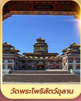
วัดพระโพธิสัตว์อูลาน