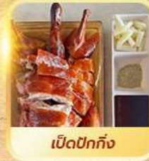
เปิดปีกทั้ง