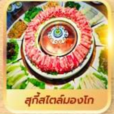
สุกีสโตลัมมองโก