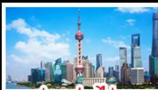
ถ่ายรูปหอไข่มุก