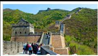
กำแพงเมืองจีนด้านจวิ้นกวน

UNIVERSAL STUDIO BEIJING DISNEYLAND SHANGHAI รถไฟความเร็วสูง - ถ่ายรูปหอไข่มุก กำแพงเมืองจีนด้านจวิ้นกวน มื้อพิเศษ เปิดปักกิ่ง, สุกี้หม้อไฟ BUFFET