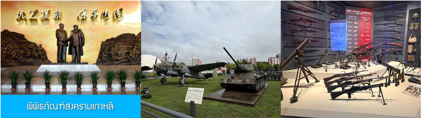
พิพิธภัณฑ์สงครามเกาหลี