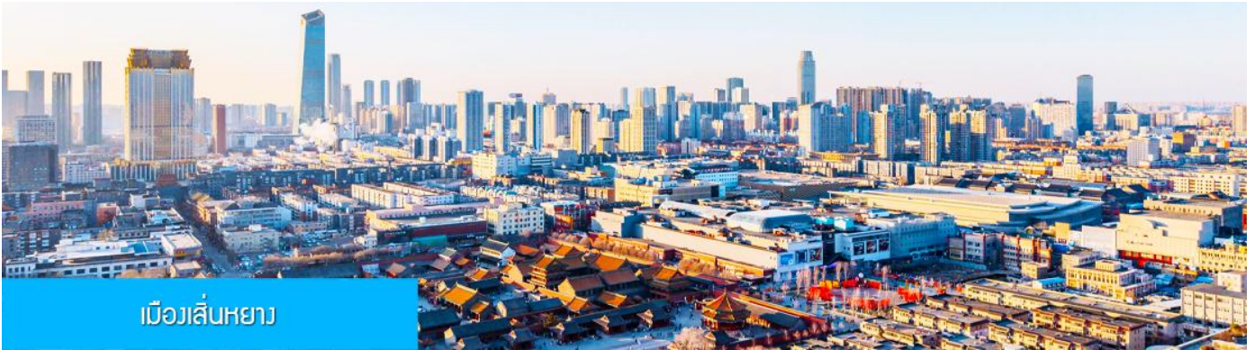
เมืองเสิ่นหยาง