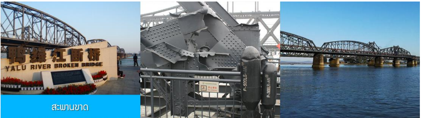
สะพานขาด