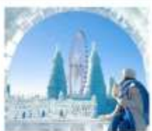
ICE & SNOW FEST.