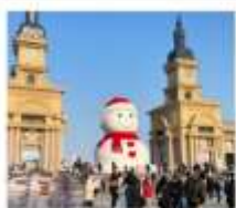
ตุ๊กตาหิมะยักษ์

โบสถ์ซันไฮเซย์ / คฤหาสน์ออลการ์ / โบสถ์ซันตปีโกล / Harbin Polar Park หมู่บ้านหิมะ: SNOW TOWN + กิจกรรมสาดน้ำร้อนกลางแจ้ง / เซาเปียงตู่ DREAM HOME (รวมค่าเช่า) / สนเสงกักตักกิมกิมเน่ย์ + สวมพาเหรดดิสนีย์ ภาพยนตร์ ICE AND SNOW (ฟรี Snow Tubing ท่าอากาศยาน) ถนนจงหยาง (ฟรี! โลกกริมหน้าตึกเอ๋อเอ๋อ) / เกาะพระอาทิตย์ (รวมรถแบดเจอร์) Harbin 2027 International Ice and Snow Festival / หอไอส์เบิร์กฮาร์บิน อุโมงค์ตุ๊กตาหิมะยักษ์ + ระเบียงดนตรี / ทะพานกระจอกไฟประวิติศาสตร์