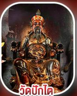
วัดปิกไต้