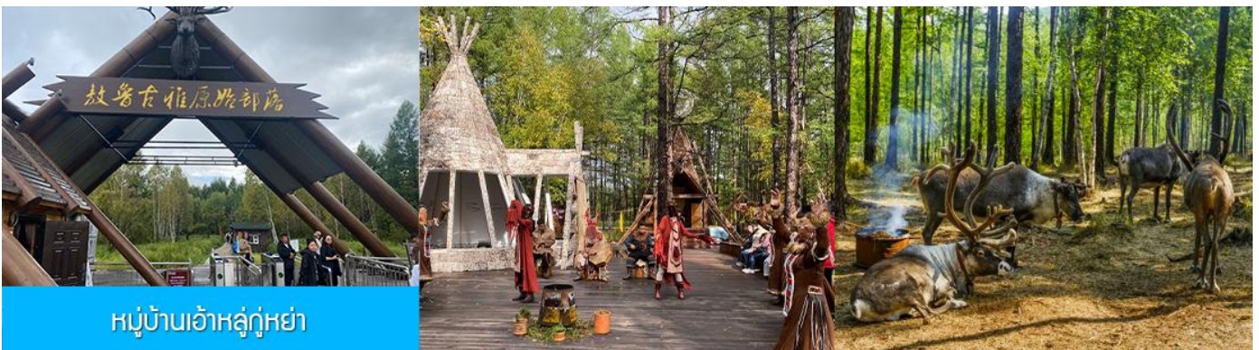
หมู่บ้านเอ้อเอ่อกู่่น่า