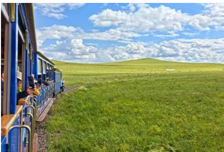
ชมบ้านชาวมองโก

เที่ยง รับประทานอาหารกลางวัน ณ ภัตตาคาร (14)