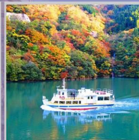
"SHOGAWA YURAN CRUISE"