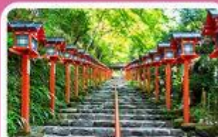
ศาลเจ้าคิฟูเนะ