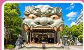
ศาลเจ้านิมมะ ยาชากะ