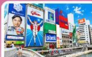
ชิบโซนาชิ