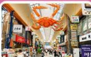
ตลาดคูโรมง