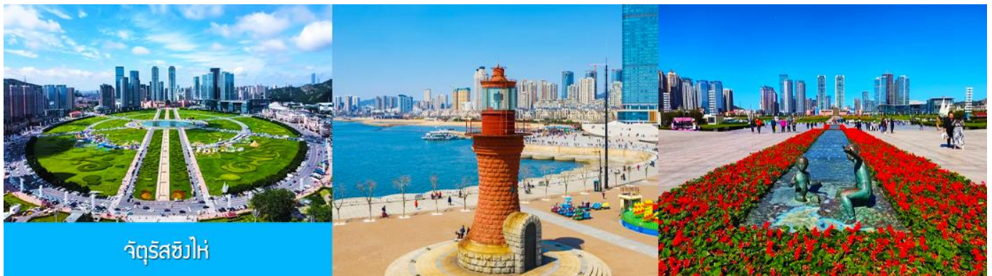
จัตุรัส星海

นำท่านเที่ยวชม ถนนญี่ปุ่น 日本风情街 เป็นอีกหนึ่งแหล่งช้อปปิ้งที่นักท่องเที่ยวไม่ควรพลาด ได้รับฉายาว่าเป็น เกียวโตน้อยแห่งราชวงศ์ถัง 盛唐小京都 ออกแบบโดยสถาปนิกชาวญี่ปุ่น และใช้วัสดุที่นำเข้ามาจากญี่ปุ่นในการก่อสร้าง ที่นี่ถูกเนรมิตให้กลายเป็น เมืองเกียวโตขนาดย่อม และเป็นจุดเช็คอิน ถ่ายภาพสำหรับนักท่องเที่ยวสมัยใหม่..