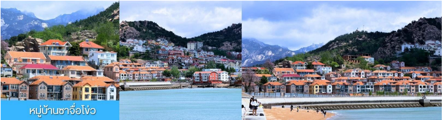
หมู่บ้านชาวโจว