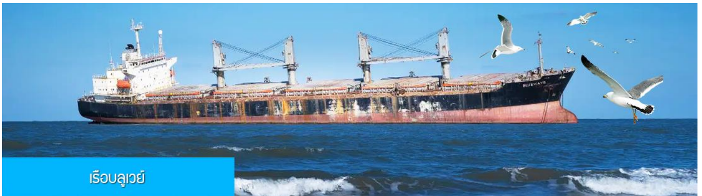
เรือลวูยี้

นำท่านชมและถ่ายภาพคู่กับ กรอบรูปยักษ์วิวทะเล 威海公园大相框 แลนด์มาร์คที่เป็นอีกหนึ่งไฮไลท์ที่ฮิต ของเมืองเวย์ไห่