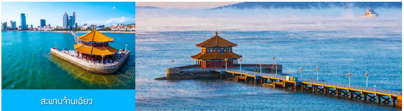
สะพานจ้านเฉียว