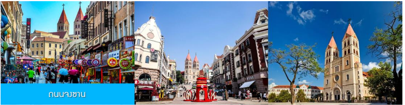
ถนนวงเวียน

จากนั้นเดินทางต่อสู่ย่าน เมืองเก่าเยอรมัน ตรอกกว้างชิงหลี่ 广兴里 ตรอกชอกชอยที่เรียงรายไปด้วยอาคารสถาปัตยกรรมแบบผสมผสานจีนและอาคารสไตล์ยุโรป