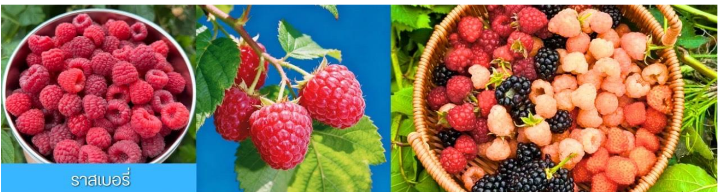
ราสเบอร์รี่