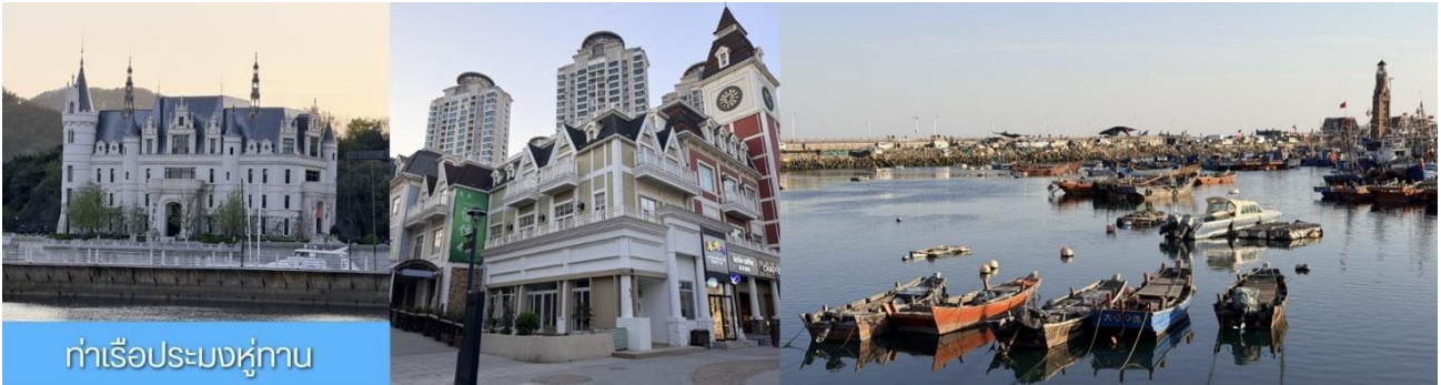
ท่าเรือประมงหู่กาน

วันที่สาม เมืองต้าเหลียน- ท่าเรือประมงหู่กาน- อ่าวหลิงเจี้ยว- พิพิธภัณฑ์ต้าเหลียน-ถนนกั๋งตงที่ 5- เมืองเวนิสตะวันออก-ไกด์ขายออฟชั่นนั่งเรือให้อาหารนก -ท่าเรือต้าเหลียน-เยินไถ (พักค้างคืนบนเรือ)