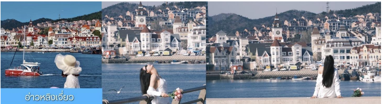
อ่าวหลิงเจี้ยว

จากนั้นนำท่านเที่ยวชม ท่าเรือประมงหู่กาน 大连渔人码头 เป็นจุดเช็คอินที่โดดเด่นด้วยสถาปัตยกรรมสไตล์ยุโรปสีสันสดใส ผสมผสานกลิ่นอายเมืองท่าดั้งเดิมเข้ากับบรรยากาศสุดโรแมนติกที่เต็มไปด้วยเรือประมง คาเฟ่ ร้านอาหาร และจุดชมวิวยุริมาทะเล