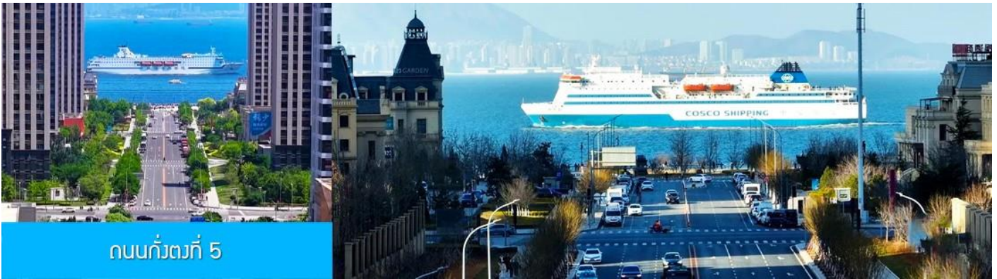
ถนนกั๋วตงที่ 5

หลังอาหารนำท่านเที่ยวชม ถนนกั๋วตงที่ 5 港东五街 จุดเช็คอินใหม่ที่ได้ได้รับความนิยมอย่างสูงจากนักท่องเที่ยวและชาวเมืองต้าเหลียน จุดนี้เป็นช่วงที่ถนนสายกั๋วตงที่ห้า มุ่งตรงสู่ทะเล(มองจากจุดชมวิวที่อยู่ด้านบน) เสมือนว่าปลายทางของถนนไปสิ้นสุดในทะเล อีกด้านจะมองเห็นท่าเรือและอาคารสถาปัตยกรรมตะวันตกเป็นกรอบของมุมมองที่งดงาม เมื่อมีเรือแล่นมาผ่านทะเลตรงบริเวณนี้ จะเป็นภาพที่สวยงามและโรแมนติก