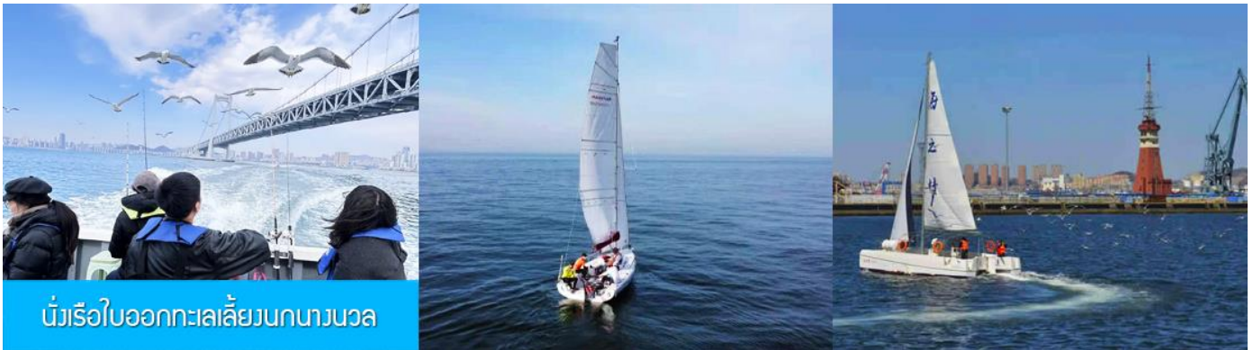
นั่งเรือใบออกทะเลลิ้งนกงางนวล

ไกด์นำเสนอโปรแกรมทัวร์เสริมหรือ OPTIONAL TOUR นั่งเรือใบออกทะเลลิ้งนกงางนวล ชมวิวชายฝั่งเมืองต้าเหลียน ใช้เวลาประมาณ 40 นาที + ขึ้นจุดชมวิวบนเขาดอกบัว (เหลียนฮัวซาน) ชมทัศนียภาพแบบพาโนรามาของเมืองต้าเหลียน + ล่องเรือคอนโดล่าในสวนน้ำเวนิส อัตราค่าบริการท่านละ 500 หยวน หรือ 2,500 บาท อัตรานี้รวมค่าบัตร รถรับส่ง ค่าประกันอุบัติเหตุ และค่าบริการของไกด์ท้องถิ่น