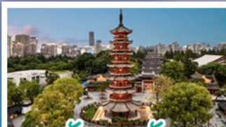
วัดเลงเซ้ง