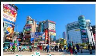
ซ้อปั้งซีเหมินตึง