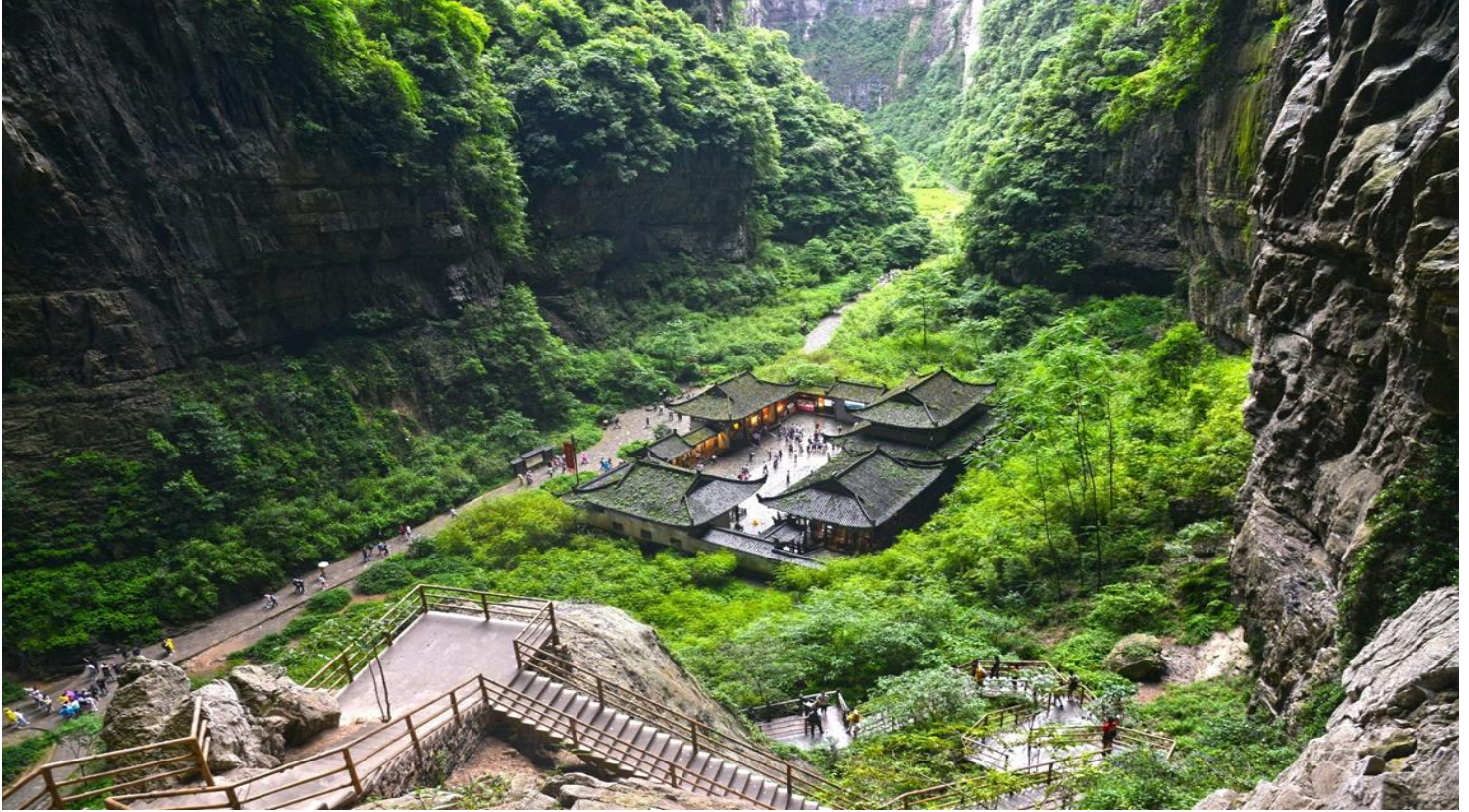
กลางวัน รับประทานอาหารกลางวัน ณ ภัตตาคาร (เมื่อที่ 3)

ในกรณีที่อุทยานฯ มีประกาศปิดบริการลิฟต์แก้วชั่วคราว หรือปิดกระเบื้องกระจก ไม่ว่าจะด้วยเหตุผลด้านการซ่อมบำรุงหรือจากสภาพอากาศที่ไม่อำนวย บริษัทฯ คำนึงถึงความปลอดภัยของท่านเป็นสำคัญที่สุด จึงขอสงวนสิทธิ์ในการปรับเปลี่ยนโปรแกรมการท่องเที่ยวให้เหมาะสมกับสถานการณ์ โดยอาจจัดหาโปรแกรมอื่นมาทดแทน ทั้งนี้ การเปลี่ยนแปลงดังกล่าวอยู่นอกเหนือการควบคุมของบริษัทฯ จึงไม่สามารถคืนเงินค่าบริการในส่วนนี้ได้ โดยบริษัทฯ จะยึดตามประกาศจากทางอุทยานฯ เป็นสำคัญ