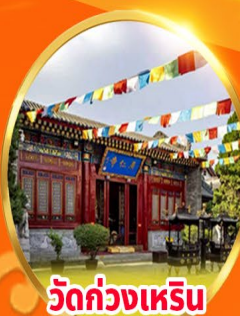
วัดก่วงเหริน