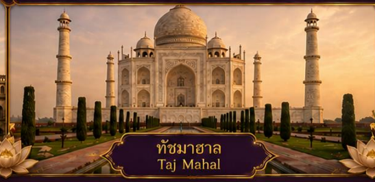
ทัชมาฮาล Taj Mahal