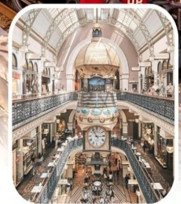
QUEEN VICTORIA BUILDING