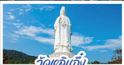
วัดเลิอัน