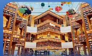
ห้องสมุดคSTARฟิค