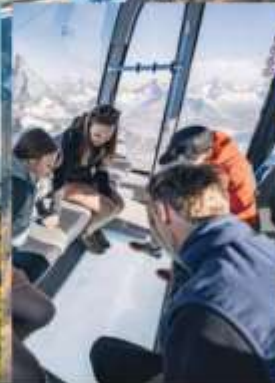
Matterhorn Glacier Paradise