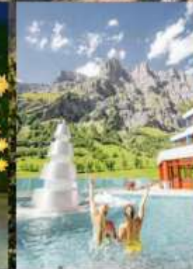
แช่สปปาลอยเทอรันา