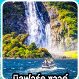
บิลฟอร์ด ซาวด์ นั่งเรือชมความงาม ฟยอร์ด