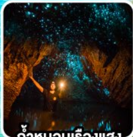
ถ้ำทอนเรืองแสง ไวโตโม