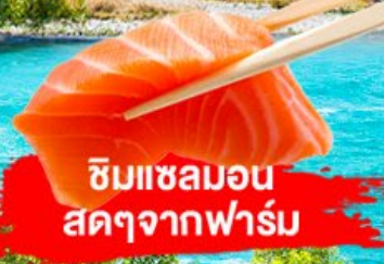
ชิมแซลมอน สดๆจากฟาร์ม